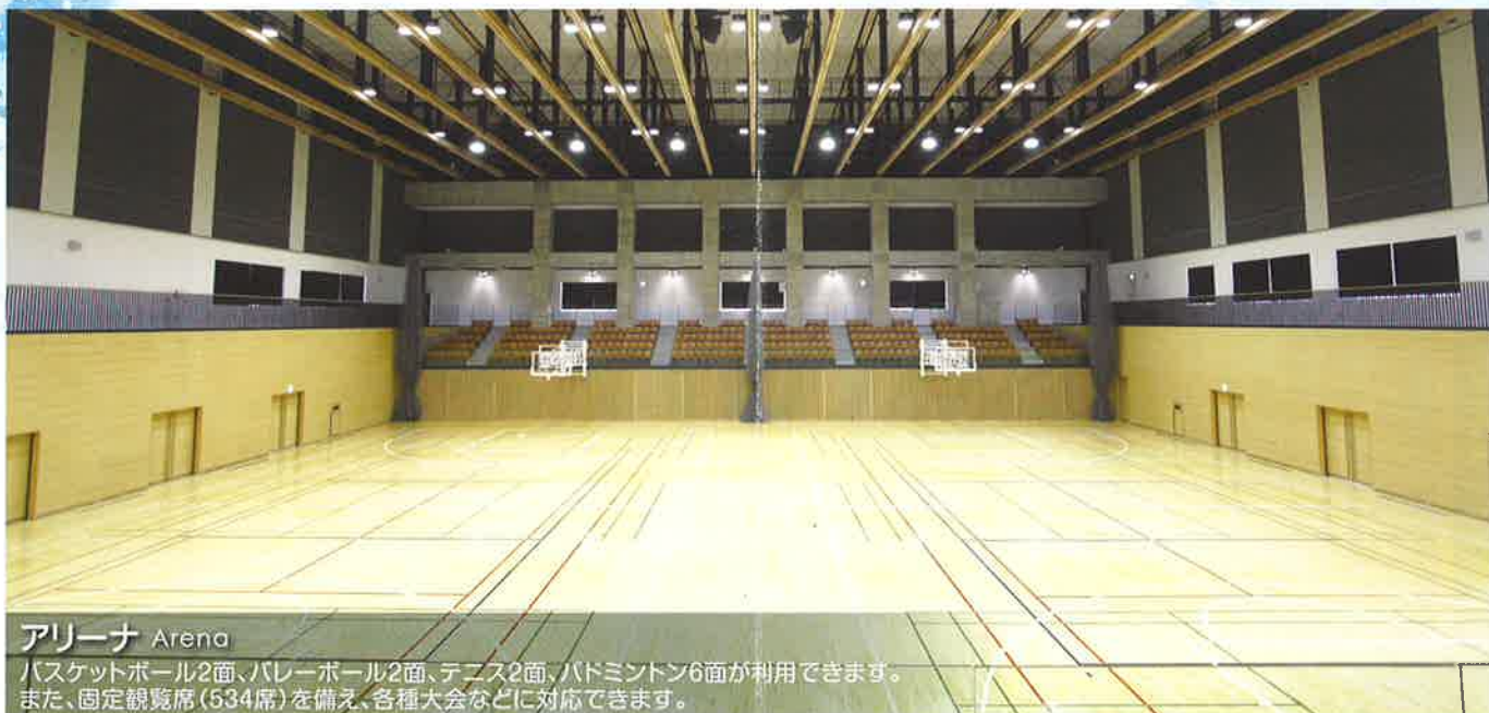
アリーナ Arena バスケットボール2面、バレーボール2面、テニス2面、バドミントン6面が利用できます。 また、固定観覧席(534席)を備え、各種大会などに対応できます。