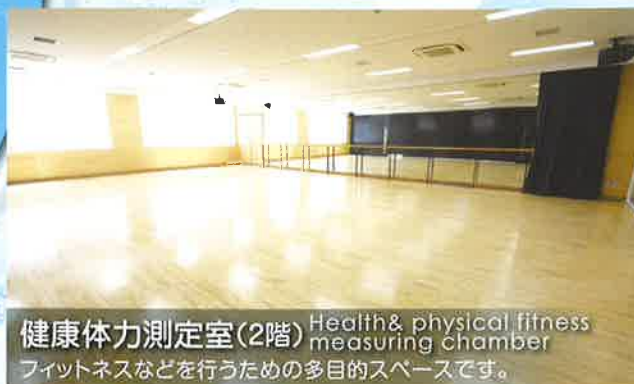
健康体力測定室(2階) Health & physical fitness measuring chamber フィットネスなどを行うための多目的スペースです。