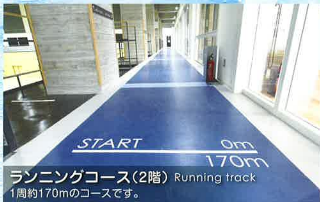
ランニングコース(2階) Running track 1周約170mのコースです。