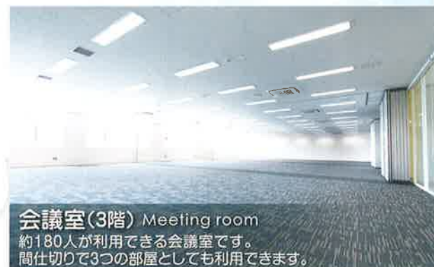
会議室(3階) Meeting room 約180人が利用できる会議室です。 間仕切りで3つの部屋としても利用できます。