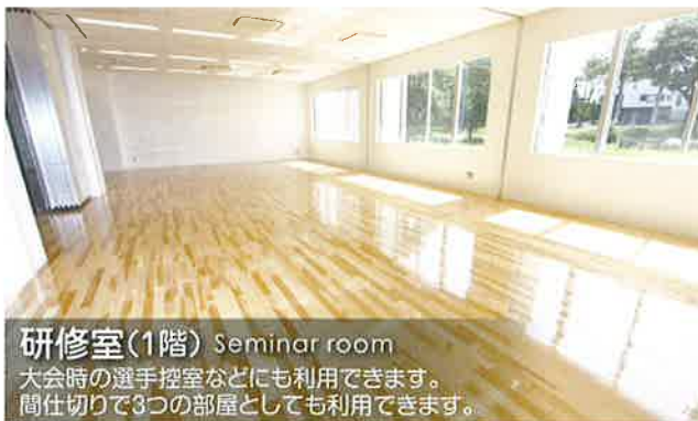
研修室(1階) Seminar room 大会時の選手控室などにも利用できます。 間仕切りで3つの部屋としても利用できます。