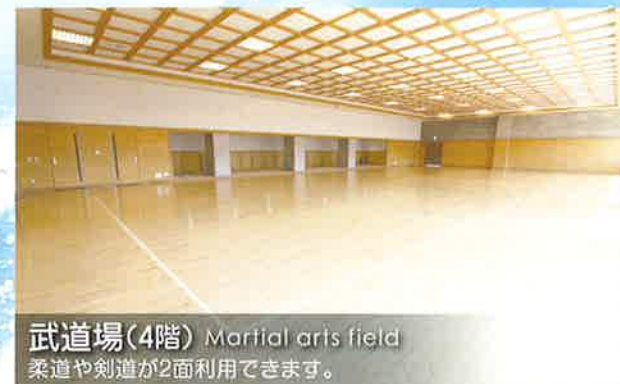
武道場(4階) Martial arts field 柔道や剣道が2面利用できます。