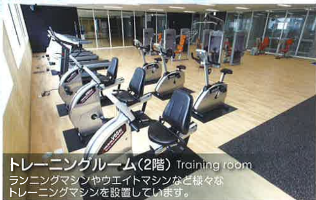
トレーニングルーム(2階) Training room ランニングマシンやウエイトマシンなど様々なトレーニングマシンを設置しています。