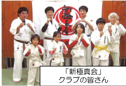
「新極真会」 クラブの皆さん

来 んスに方目方希の生児なまのち六会 「て是でで合、的、望女、いす方やん六一私 押く非い楽わそとより、性、小、心。々々ん六た 耐だ一ましせれ強る、健、エ、生、を、求、め、に、負、い、層、あ ！さ度す。空マれ一。空年増ト、め、に、負、い、層、あ い、。手イの般手層進目、め、に、負、い、層、あ 。体、手イの般手層進目、め、に、負、い、層、あ 験、手イの般手層進目、め、に、負、い、層、あ に、手イの般手層進目、め、に、負、い、層、あ