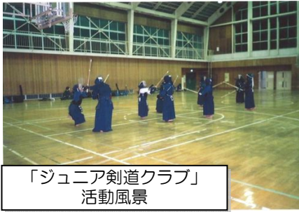
「ジュニア剣道クラブ」 活動風景

いとび道 ま積宿とて多励間い基以昭ツ なり、を団す。極やのい数み約まづ来和少一 ます。り正員。的影交まの、八す。日。剣十団「 す。こつしに 虎流す。賞区回週々道八」と道 とばくつ 参物会。他者大の二活の年とス をな真い 加語、他者大の二活の年とス 願社剣て しな練のを会稽回動理にしてポ つ会には てど成団だで古、し念設て、 て人学剣 いに合体しはに年てに立