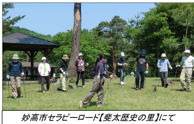
妙高市セラピーロード【斐太歴史の里】にて

今年も開催中！五月二十七日（日）に、本年度の第「ゼミナー・ブルディックウォーキング」を開催しました。講師は、ブルディックウォーキングの指導者、ブルディックウォーキングの指導者、ブルディックウォーキングの指導者。参加者も多く、大評判です！