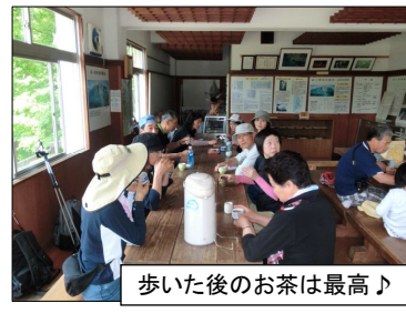
歩いた後のお茶は最高♪