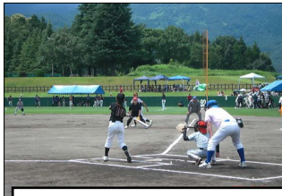
第26回「ソフトボール大会」