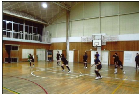
バレーボールクラブ【PIECE10】の練習風景