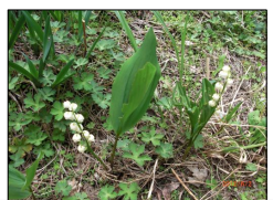
咲き始めた「すずらん」