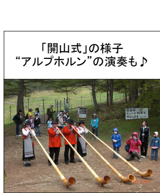
「開山式」の様子 「アルプホルン」の演奏も♪

「気分良く」 「開山式」の様子 「アルプホルン」の演奏も♪ 「気分良く」 「開山式」の様子 「アルプホルン」の演奏も♪ 「気分良く」 「開山式」の様子 「アルプホルン」の演奏も♪