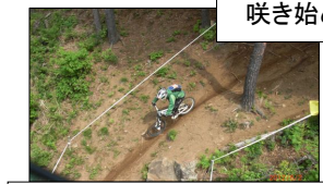
「全日本マウンテンバイク選手権大会」が開催中!

「参加者の声」 「開山式」の様子 「アルプホルン」の演奏も♪ 「参加者の声」 「開山式」の様子 「アルプホルン」の演奏も♪ 「参加者の声」 「開山式」の様子 「アルプホルン」の演奏も♪