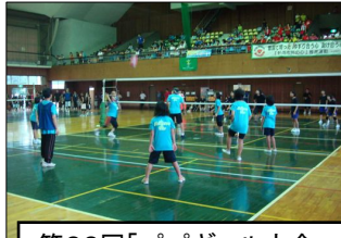
第22回「パパギヤル大会」