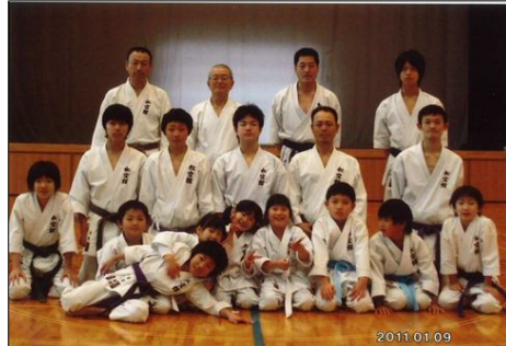
空手クラブ【松空館ARAI】のみなさん

○（高自く企すか、在年館さ） 八代身、画。ら、と一 一代表場向それも？ま、六員、十二して「広とらわれなず、真の強