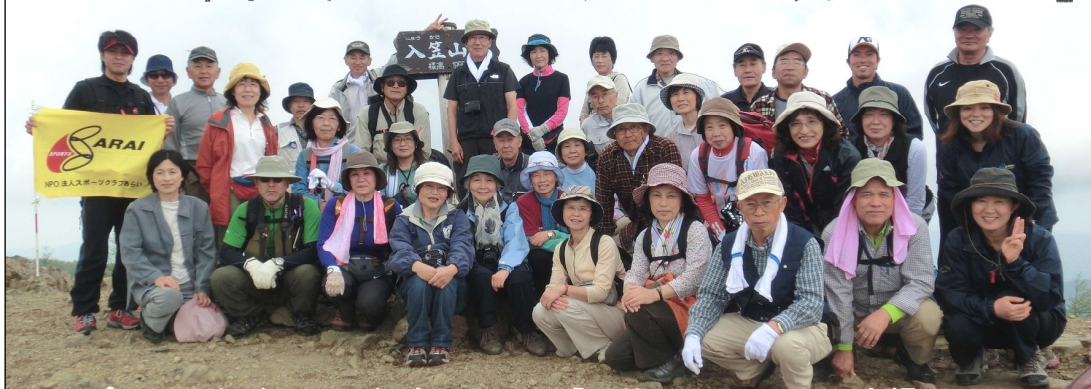
アルプス山々をバックに、標高1,955mの「入笠山」山頂にて記念撮影