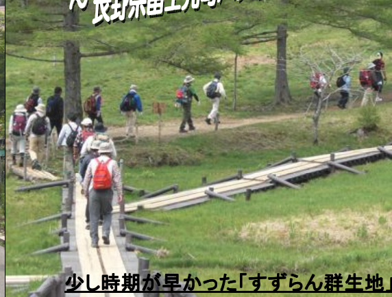
少し時期が早かった「すずらん群生地」